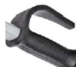
12337 Poignée Ergo avec garde de protection