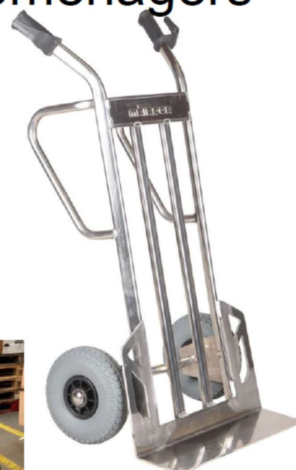
18834 M-NST500-CT ALUMINIUM

En option : protection en caoutchouc : (composé d'un dos ovale en caoutchouc (caoutchouc SEBS 70 ° Shore noir 6 mm d'épaisseur) et de capuchons de protection (amortisseurs cylindriques au-dessus de la Bavette)