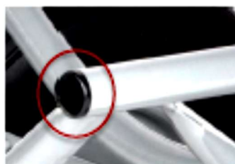
Embout plastique de finition