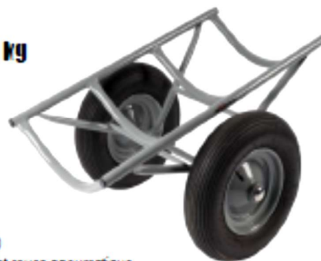
13080 Chariot roues pneumatique