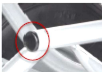
Embout plastique de finition